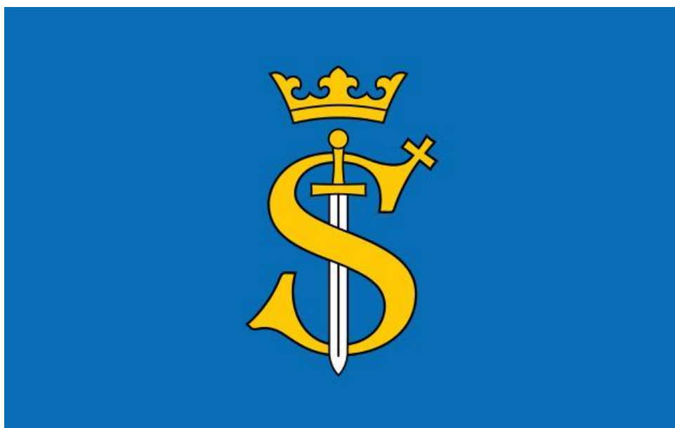
Flaga Gminy Skawina

Flaga Gminy Skawina: w polu płata o proporcjach 5 \times 8 , barwy błękitnej, umieszczone centralnie godło Skawiny: monogram – majuskułową literę „S”, z krzyżem zaćwieczonym na końcu górnego łuku litery. Litera opleciona wokół prostego miecza, zwróconego ostrzem do dołu. Ponad literą i głowicą miecza – korona otwarta o trzech sterczynach. Pole płata błękitne, litera, krzyż, korona i rękojeść miecza – złote, ostrze miecza – srebrne. Flaga jest dwustronna.