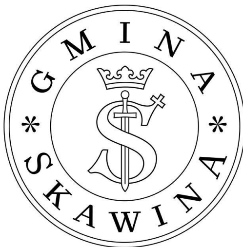
Pieczeń Gminy Skawina

Pieczeń: w polu okrągłej pieczęci o średnicy 36 mm umieszczone centralnie godło Skawiny: monogram – majuskułową literę „S”, z krzyżem zaćwieczonym na końcu górnego łuku litery. Litera opleciona wokół prostego miecza, zwróconego ostrzem do dołu. Ponad literą i głowicą miecza – korona otwarta o trzech sterczynach. W otoku majuskułowy napis: „Gmina Skawina”.