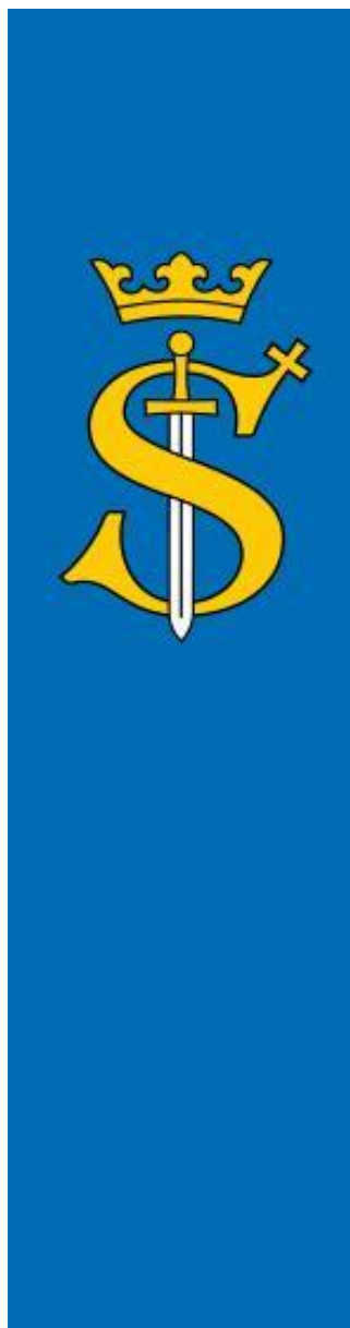
Banner Gminy Skawina

Banner Gminy Skawina: w polu płata o proporcjach 4 \times 1 , barwy błękitnej umieszczone w 1/3 wysokości godło Skawiny: monogram – majuskułową literę „S”, z krzyżem zaćwieczonym na końcu górnego łuku litery. Litera opleciona wokół prostego miecza, zwróconego ostrzem do dołu. Ponad literą i głowicą miecza – korona otwarta o trzech sterczynach. Pole płata błękitne, litera, krzyż, korona i rękojeść miecza – złote, ostrze miecza – srebrne. Banner wieszany na pionowym maszcie jest dwustronny, na poziomym – jednostronny.