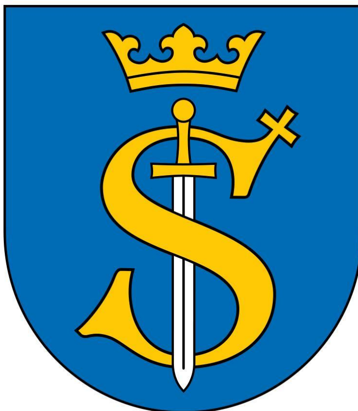
Herb Gminy Skawina

Godło herbu Gminy Skawina przedstawia: w polu późnogotyckiej tarczy, o pół-okrągłej podstawie i prostej głowicy, monogram – majuskułową literę „S”, z krzyżem zaćwieczonym na końcu górnego łuku litery. Litera opleciona wokół prostego miecza, zwróconego ostrzem do dołu. Ponad literą i głowicą miecza – korona otwarta o trzech sterczynach. Pole tarczy błękitne, litera, krzyż, korona i rękojeść miecza – złote, ostrze miecza – srebrne.